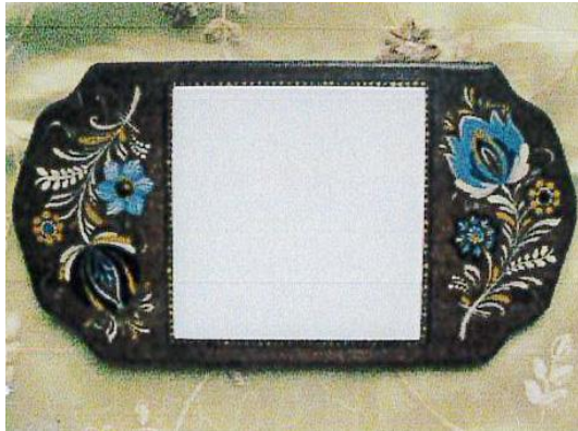
3.オーストリア上部地方 玉ねぎ模様