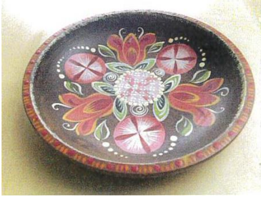
1.チロル シャハテル

チロル、オーストリア、ドイツ、フランス、伝統のマーレイを元に 色々なカテゴリーの作品を仕上げていきます。