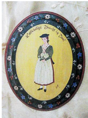
5.チロルの民族衣装