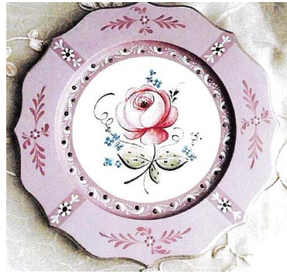
4.南ドイツ 黒い森地方のばら