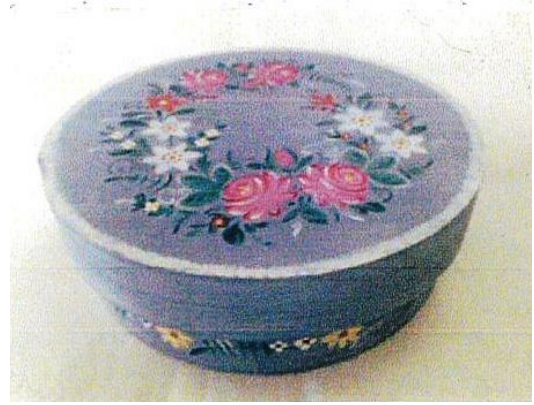
2.オーストリアスタイルの花