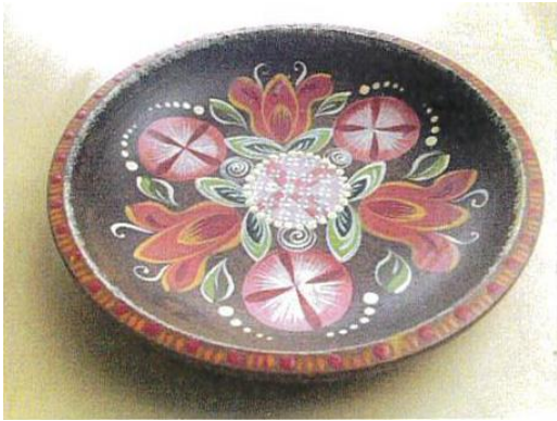
1.チロル シャハテル

チロル、オーストリア、ドイツ、フランス、伝統のマーレイを元に 色々なカテゴリーの作品を仕上げていきます。