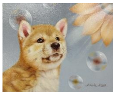
初級作品 サイズ 26.6×21.5×1.7cm